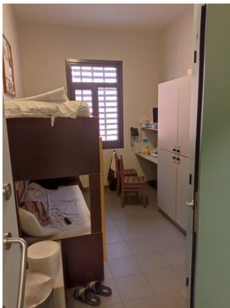
Duocel in Wortel (foto)