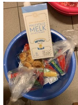
De wekelijkse, gratis bevoorrading

De directie neemt de opmerkingen met betrekking tot het eten ter harte en tracht een wijziging in het contract te bekomen dat mogelijk zou maken om de voeding warm te leveren in grote containers. In december werd dit systeem al uitgetest. Dit werd enthousiast onthaald en het systeem wordt verdergezet in 2024. Bovendien werd een systeem uitgewerkt waarbij diegenen die na de bedeling nog wat bij wensen, hun lampje aandoen om dit aan te geven. Dit zorgt niet alleen voor minder overschotten en meer tevredenheid bij gedetineerden, maar creëert eveneens extra arbeid (zowel voor het extra werk bij de bedeling als bij de afwas van de containers achteraf).