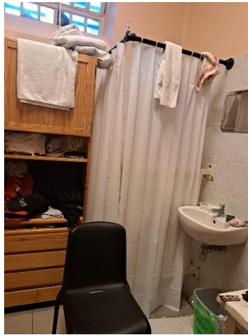
Het douchegordijn dat het toilet afschermt van de rest van de cel

Met betrekking tot de infrastructuur was voornamelijk het gebrek aan privacy, bijvoorbeeld bij het toiletbezoek, een terugkerende melding. Hierrond werd het afgelopen jaar door de directie bekomen dat in elke cel een douchegordijn werd voorzien rondom het toilet. Dit beïnvloedde de sfeer binnen de inrichting op positieve wijze.