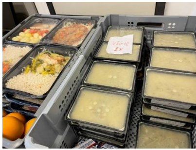
De extern aangeleverde maaltijden en soep

In de inrichting van Tongeren is geen ingerichte keuken aanwezig. Maaltijden en soep worden extern aangeleverd in individuele plastic bakjes. Deze voeding wordt koel bewaard en dagelijks verdeeld. De gedetineerden warmen deze maaltijden vervolgens op in de microgolfoven waarover zij op cel beschikken. Reeds geruime tijd ontvangt de CvT gemengde signalen over de voeding. Niet alle gedetineerden zijn ontevreden, doch lijkt enige verklaring te vinden in de vergelijking die sommigen kunnen maken met inrichtingen die wel over een eigen keuken beschikken. Zij ontvangen eveneens wekelijks een pakket met beleg (zoals chocopasta, chocolade en kaas), melk, suiker, boter en poffertjes. De gedetineerden geven over het algemeen aan tevreden te zijn over de broodmaaltijden en het hiervoor aangeboden beleg.